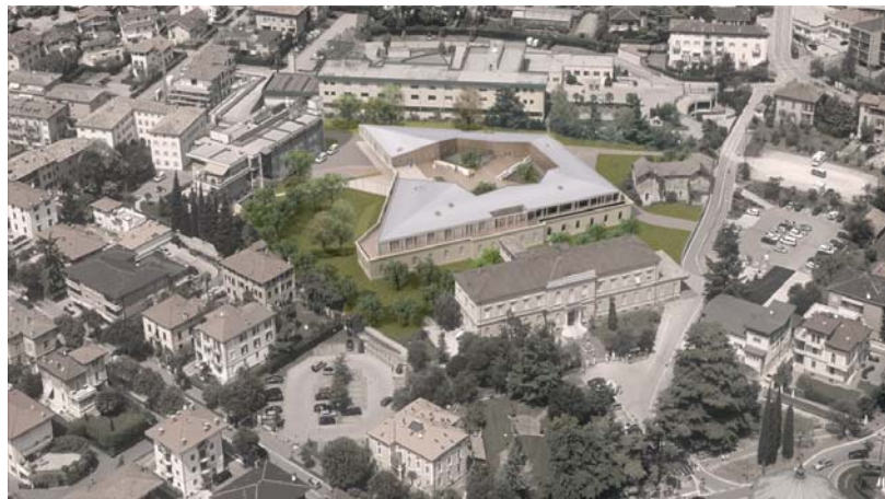
Figura 6 Rsa Riva del Garda Trento

Impianti della nuova Casa di Riposo di Riva del Garda (TN). anno 2011