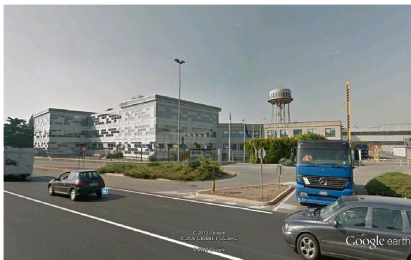
Figura 4 Palazzina Uffici Almag Roncadelle (BS)

Ampliamento della palazzina uffici della "ALMAG" in Roncadelle (BS). anno 2010