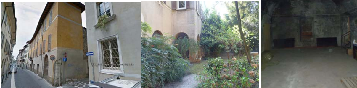
Figura 10 unità immobiliare via delle Battaglie 38 Brescia

Autorizzo il trattamento e la comunicazione dei dati personali ai sensi della legge 675/96