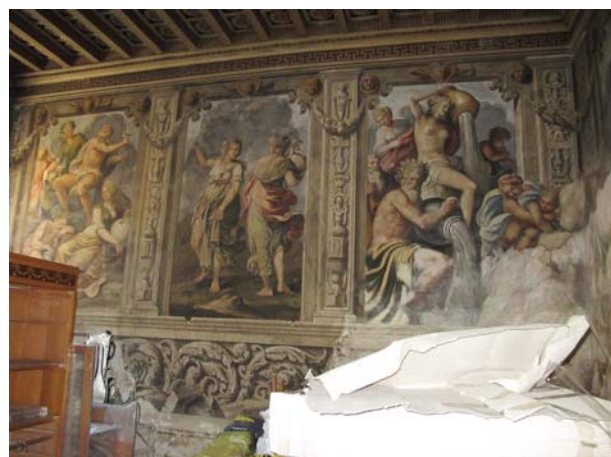
Figura 8 Palazzo in via San Francesco 8 Brescia