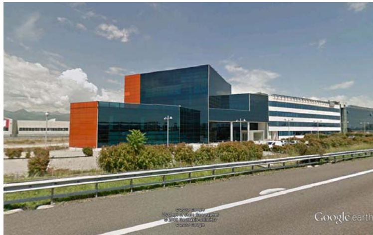
Figura 3 Sede Systema s.r.l.

Progetto e realizzazione impianti della sede direzionale della "SYSTEMA S.r.l" in Grassobio (BG). anno 2006