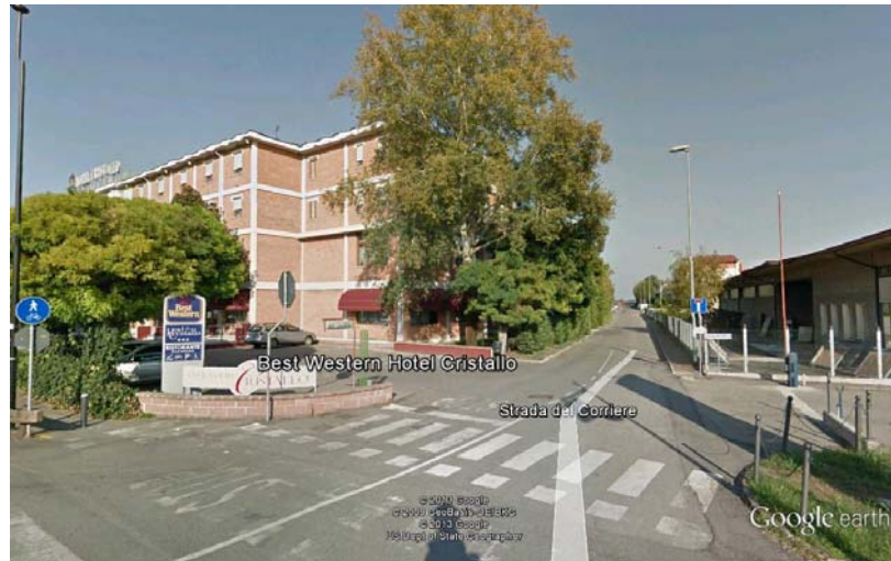
Figura 5 Hotel Cristallo Mantova

progettazione e DL impianti del Centro Congressi dell'Hotel Cristallo di Mantova.