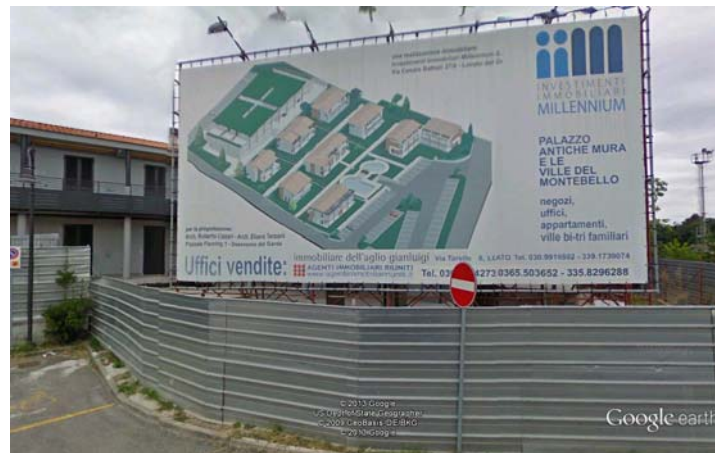
Figura 9 spazi commerciali della Società Immobiliare Millenium