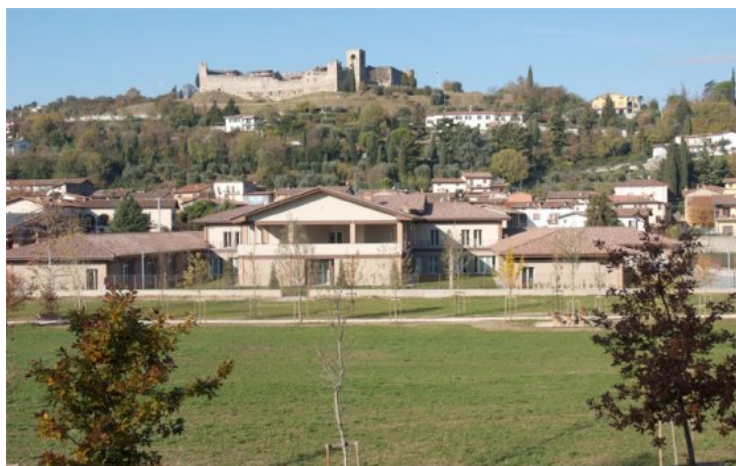
Figura 1 RSA padenghe del Garda (BS)

Progettazione e realizzazione della nuova Casa di Riposo di Padenghe S/G (BS). anno 2010