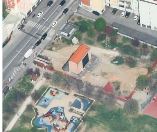
Figura 7 fienile del parco il Pescheto via Corsica Brescia